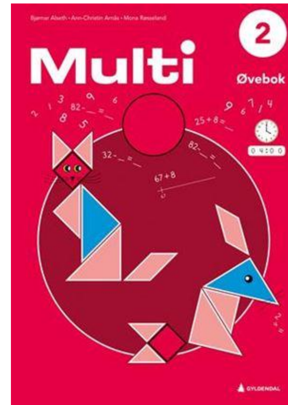
Multi – matematikk